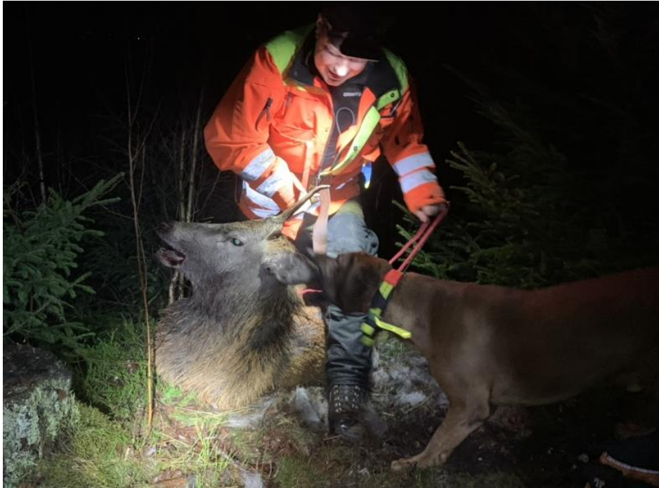
Ordförande och "Walle" efter hetz på en liten kronhjort

Ännu en jaktsäsong går mot sitt slut. För min del har familj, släkt och jobb gjort att jag inte riktigt hunnit med jakt som jag velat. Några spännande eftersök har det ändå blivit men inte så mycket med annan jakt. Tyvärr har jag fått ett vargrevir inpå knuten. Innan man själv upplever detta inser man inte vilken olust det väcker. Att känna oron varje gång man släpper sin hund om det överhuvudtaget är möjligt. Det är ett hot mot all etisk jakt och djurhållning. Tänk på detta när ni röstar fram våra politiker i de kommande valen, inte minst EU valet.