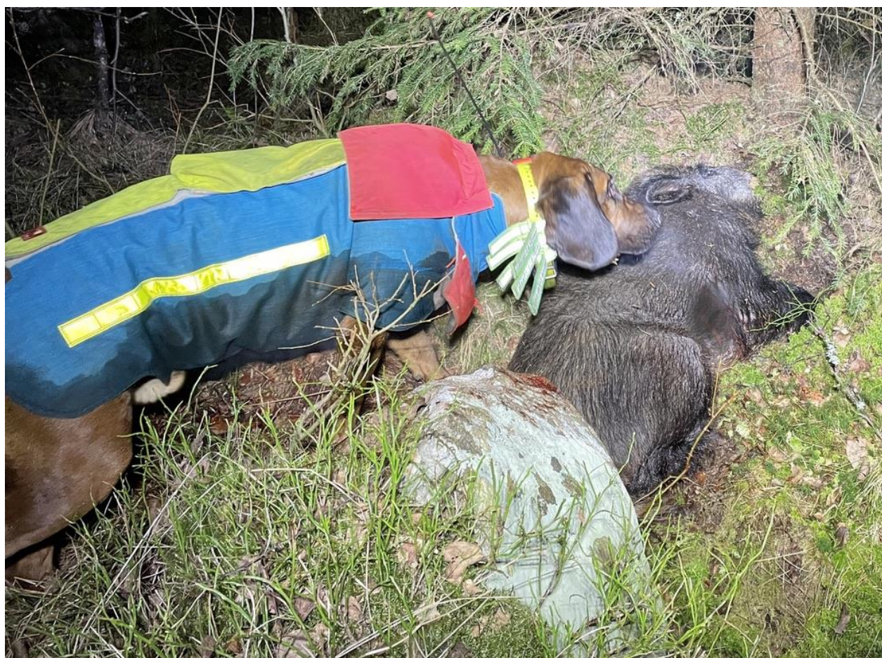
Bobbo med sin första gris skjuten efter ståndarbete